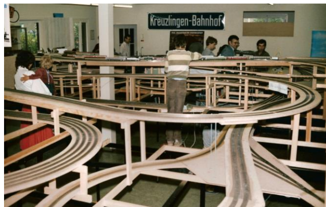
Rohbau unserer Anlage im Mai 1982

Unter dem Jahr gibt es weitere Aktivitäten wie Ausflüge, Grillabende usw.